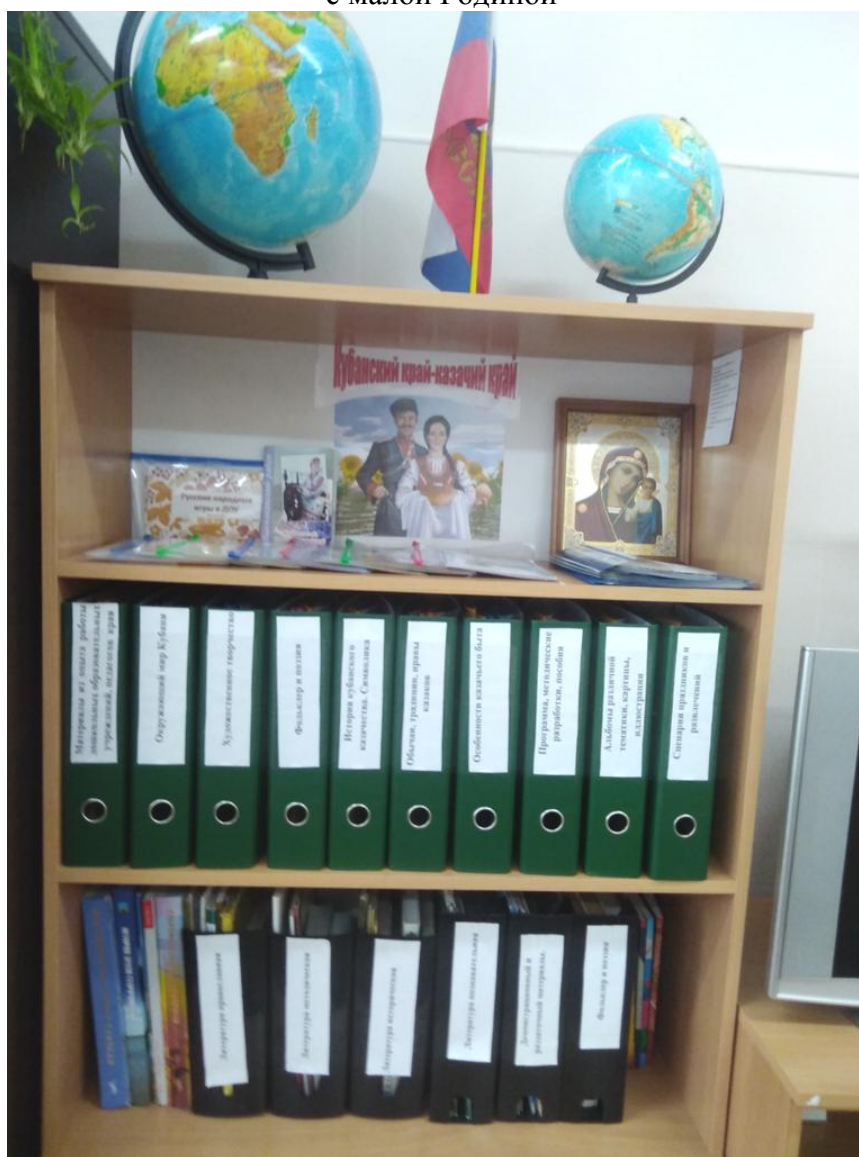
Методический и демонстрационный материал