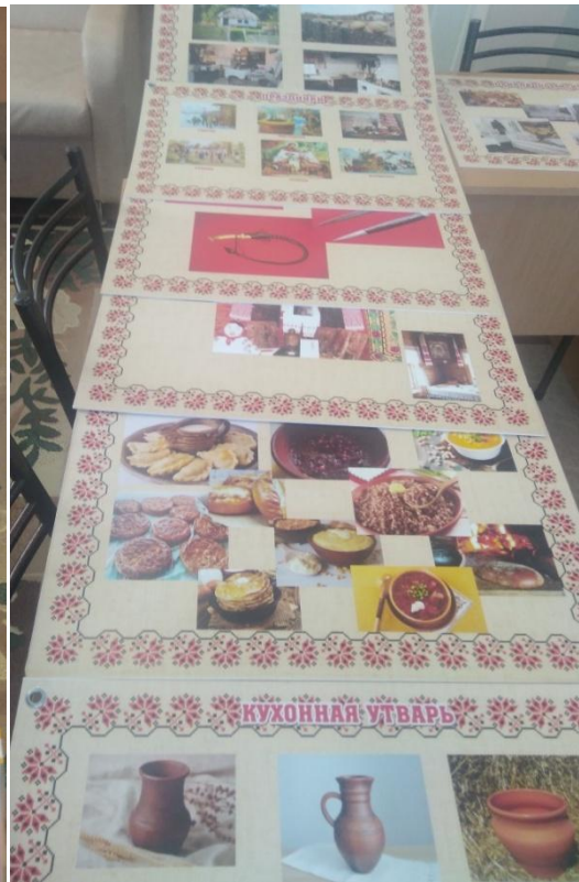
Казачьи уголки в группах: