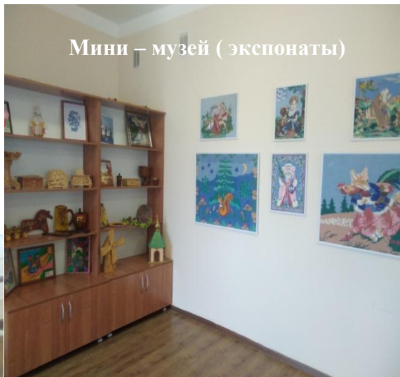
Мини – музей ( экспонаты)