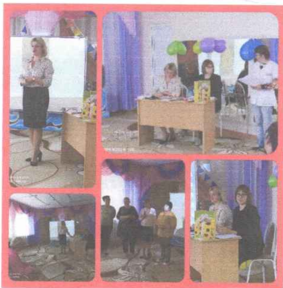
Результаты работы молодых педагогов